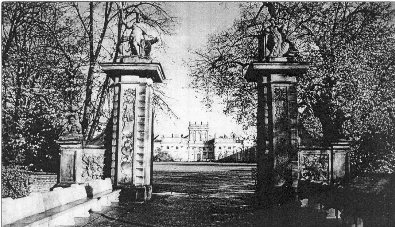
Wilanów. 310 lat temu zmarł tu „Lew Lechistanu” - Pogromca Turków, obrońca Chrześcijańskiej Europy.